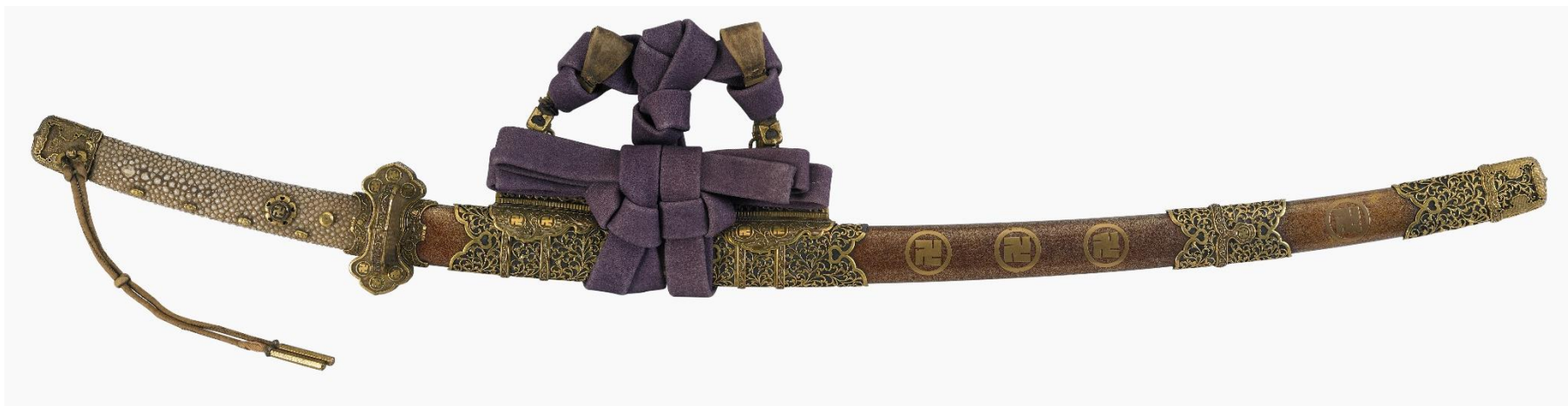
金梨子地左卍紋蒔絵飾太刀拵 江戸、全長95.9cm、蜂須賀家旧蔵、市指定有形文化財、当館蔵