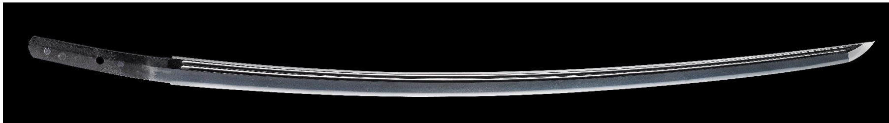
太刀 銘 祐光 室町末期、刃長69.0cm、反り2.3cm、蜂須賀家旧蔵、市指定有形文化財、当館蔵