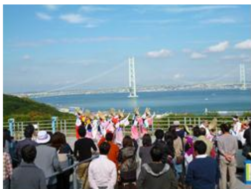
共同観光キャンペーン【淡路SA】