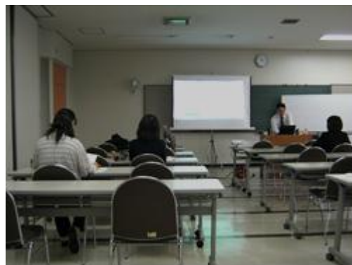
コミュニティビジネス創業セミナー

○コミュニティビジネスの起業を目指している人を対象にしたコミュニティビジネス創業セミナーを11月から12月にかけて開催（5回連続講座）