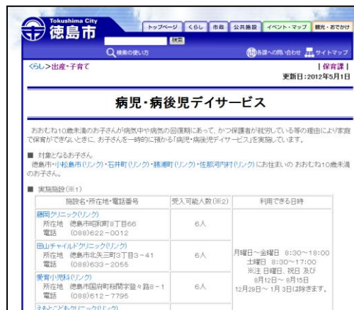
徳島市ホームページ