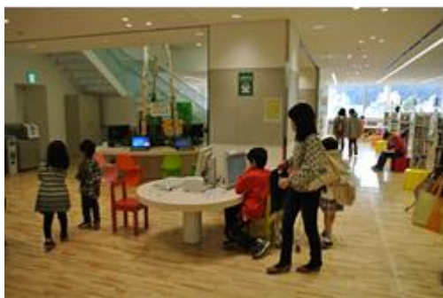
徳島市立図書館 5階