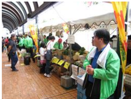
とくしま食材フェア2011