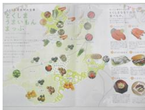
特産品紹介リーフレット