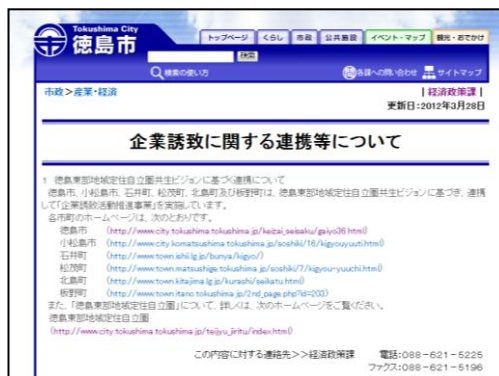
企業誘致ホームページ

○担当者部会を10月に開催し、連携市町の企業誘致ホームページについて意見交換 ○平成24年3月から連携市町の企業誘致ホームページの相互リンクを実施