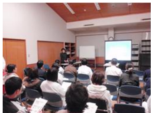
感染管理合同研修会