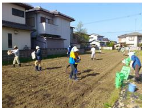
野菜栽培技術実習