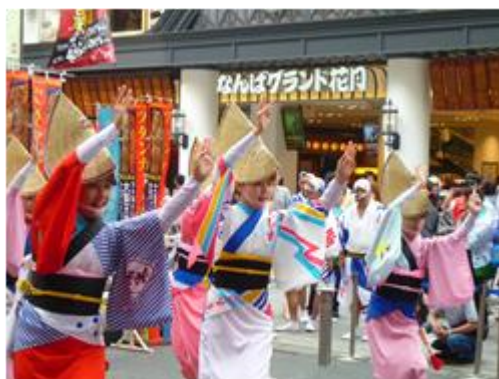
観光キャンペーン