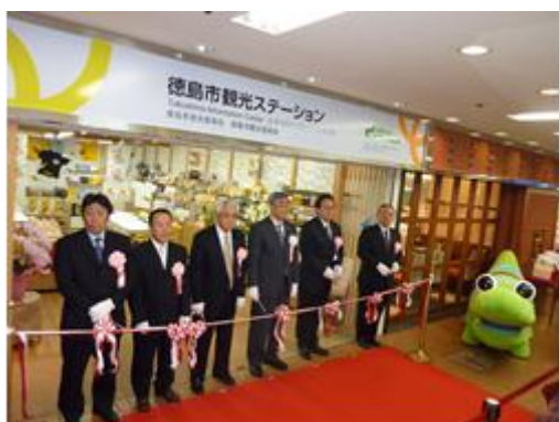
広域観光案内ステーション