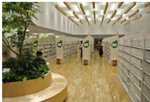
徳島市立図書館 6階