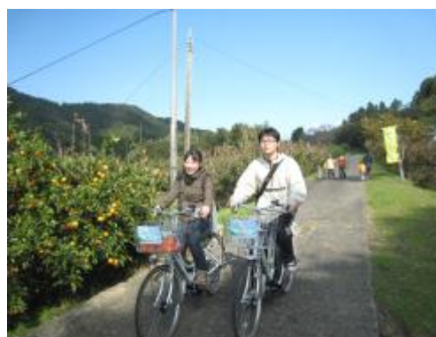
レンタサイクルツアー