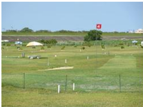
パークゴルフ場(藍住町河川敷運動公園)