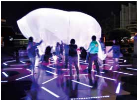
▲徳島LEDアートフェスティバル2013の様子

【所在地】 元町1-24 アミコビル地下1階 【営業時間】 9:00~19:30 (元日は除く) 【電話】 635-9002