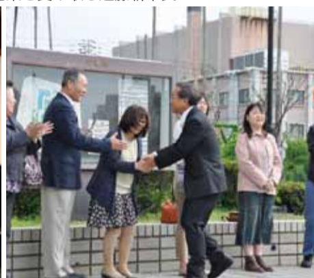
▲市役所に初登庁する様子