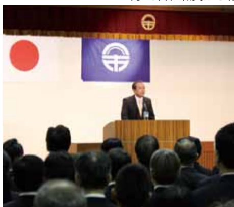
▲就任のあいさつの様子