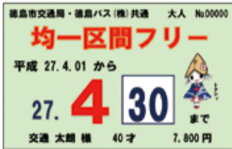
▲市内均一フリー定期券イメージ

現在、210円(市内均一区内の全路線(徳島バス運行路線を含む。乗り継ぎ可)で利用できるもの)です。4月1日(水)から、トクシイ市均一回数乗車券(110円券・210円券)は、徳島バスが運行する全ての路線で利用でき、他の回数乗車券や現金との併用もできます。