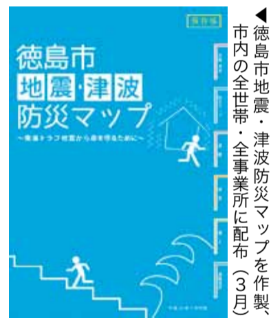
▲徳島市地震・津波防災マップを制作市内の全世帯・全事業所に配布(3月)