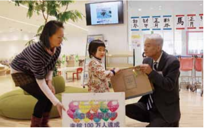
▲徳島市立図書館が移転後1年10カ月で来館者100万人を達成(1月)