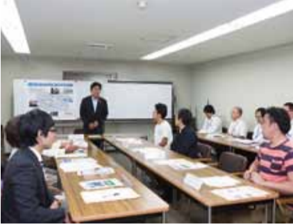
▲川を生かした水都・とくしまの魅力発信のための取り組みを推進=ひょうたん島川の駅ネットワーク構想を策定(6月)、ひょうたん島川の駅連絡会を設立(8月、写真上から2枚目)、「川いいね!とくしま。」をテーマに徳島ひょうたん島博覧会2014を開催(9月、写真右・上から1枚目)