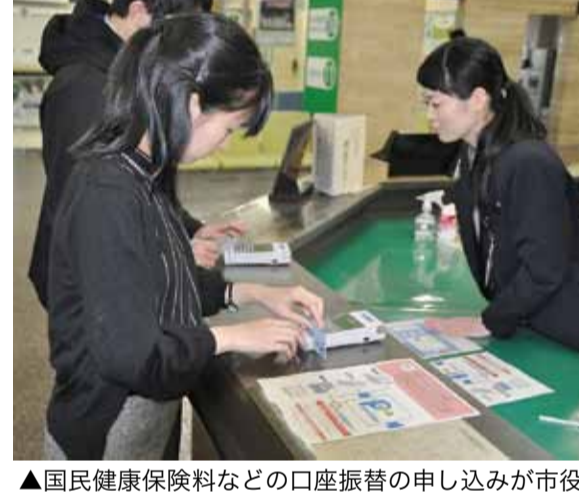
▲国民健康保険料などの口座振替の申し込みが市役所窓口でできる「ペイジー口座振替受付サービス」を四国の自治体で初めて導入(10月)