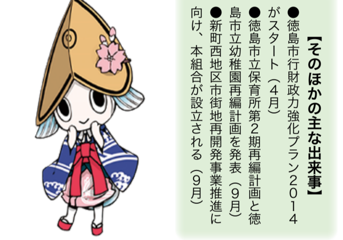
▲「そのほかの主な出来事」がスタート(4月)