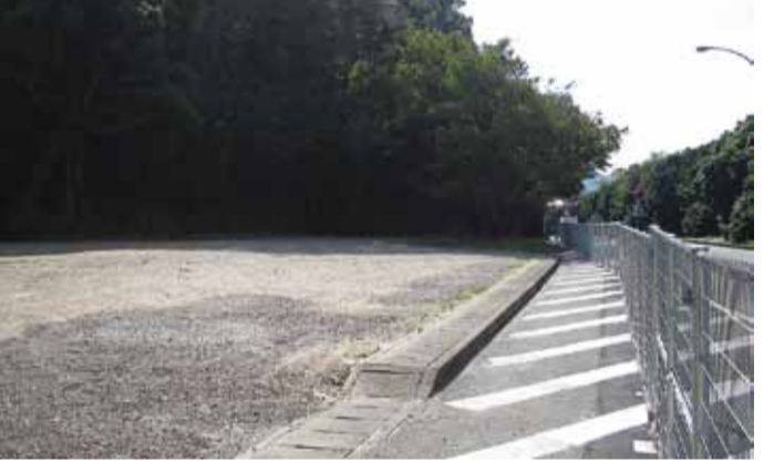
▲地震・津波から市民を守る津波避難施設の整備進む=津田山に津波避難路・避難場所を確保(津田西町・3月、新浜本町・11月、写真左)、津波避難場所の確保のため649棟の津波避難ビルを指定(～11月、写真右)