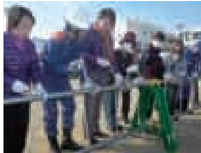
▲徳島市市民総合防災訓練(東富田地区)=昨年11月