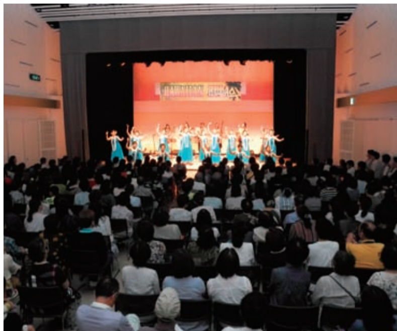
▲コンサートや発表会などに利用されているシビックセンター4階多目的ホール

め、「やさしいコーラス(合唱)」や「織物教室」「阿波踊りぞめき教室」「パソコン・インターネット活用講座」など21の講座を開講しています。平成25年度前期文化講座の受講生の修了作品展と発表会を右下表のとおり行います。また、10月から開講する後期文化講座の受講生を9月19日(木)まで募集しています。詳しくはお問い合わせください。