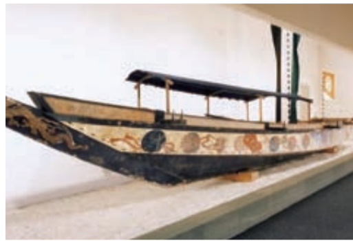
徳島城博物館で展示されている「千山丸」

「徳島ひょうたん島博覧会」プレイベントを開催します 「たん島博覧会」のプレイベント「助任川造船所」ダンボールで平成の千山丸をつくろう」を次のとおり開催します。