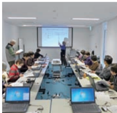
▲パソコンやプロジェクターなどを備えた4階活動室