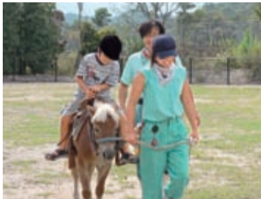
動物愛護の標語とどうぶつで五・七・五の表彰式=14:00~

「徳島ひょうたん島博覧会」プレイベントを開催します 「たん島博覧会」のプレイベント「助任川造船所」ダンボールで平成の千山丸をつくろう」を次のとおり開催します。