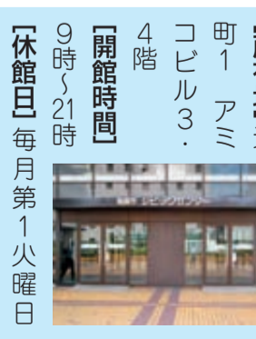
シビックセンター

【シビックセンター】 所在地 徳島市幸町2-5 町1 アミコビル3・4階 【開館時間】 9時~21時 【休館日】毎月第1火曜日と1月1日 【入館料】無料 【営業時間外入り口】 ▼アミコラインパークからは、アミコ入り口左の階段を上がり、3階広場へ ▼徳島駅からは、その隣の噴水横の階段を上がり、2階の通路を西へ進み、階段を上がって3階広場へ 【電話番号】☎(0876)0408