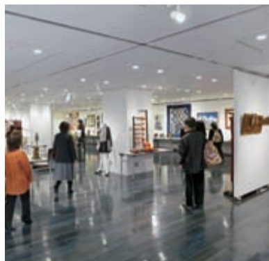
▲週替わりで作品展などが開かれている3階ギャラリー