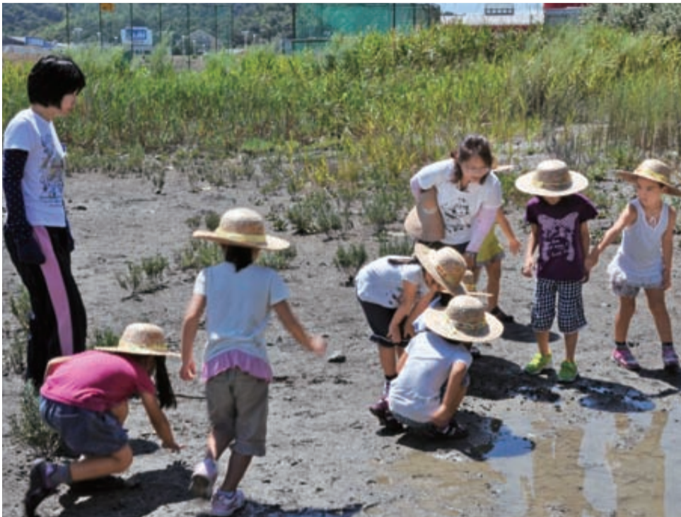
▲環境リーダーが講師となって行われた出前環境教室「干潟であそぶ」＝勝浦浜橋下

環境リーダーは「水環境」「自然環境」「地球環境」「廃棄物(清掃活動など)」「環境教育」など、それぞれ得意な分野を生かした活動を行います。