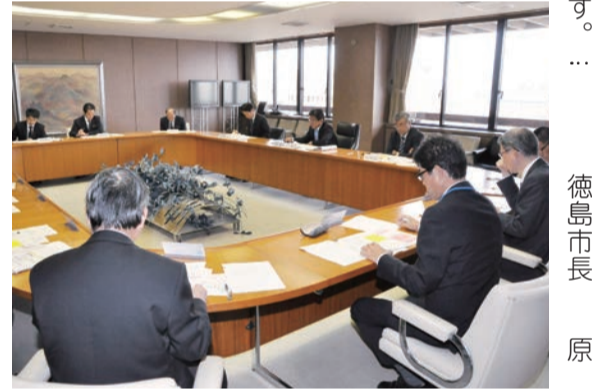
▲津波浸水想定を発表を受けて開かれた、原市長が会長を務める「徳島市地震対策検討会議」=11月

また、防災の基本は「自助」「共助」「公助」とされていますが、先日出席した講演会で、近隣の人同士が助け合う「近助」が大切だという話がありました。私もまさにその通りだと思えます。