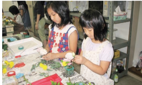
▲紙ひこうき作り(上)・生け花教室(下)