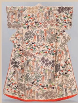
▲「白紵子地卍立涌紗綾形藤葵花束模様打掛」

「吉」と「祥」は、「よいこと」や「めでたいこと」などの意味を表します。大名家に伝来する染織品には、この吉祥の意匠があらわれるものが多く、蜂須賀家ゆかりの服飾もその例外ではありません。