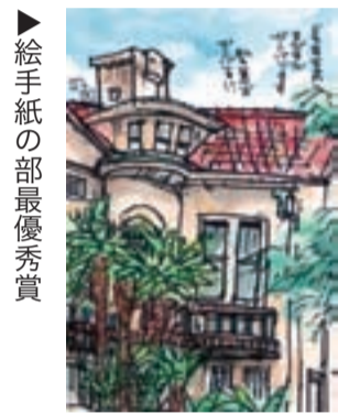
絵手紙の部最優秀賞

同コンクールは、とくしま観光ボランティア会との協働事業として実施。絵手紙の部には61点、写真の部には63点の応募があり、各部門最優秀賞1点と優秀賞2点を選出しました。入賞作品は徳島市ホームページに掲載しています。