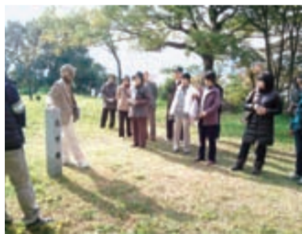
▲昨年11月のぐるりんツアーの様子

◆ボランティア友の会会員 徳島城博物館では、展示会などのガイド、イベントの実施や手伝い、ミュージアムショップの運営を行う「ボランティア友の会」の会員を募集します。活動は週1回の参加を原則とし、活動開始前に、3日間程度の研修を受けていただきます(4月6～8日の予定)。