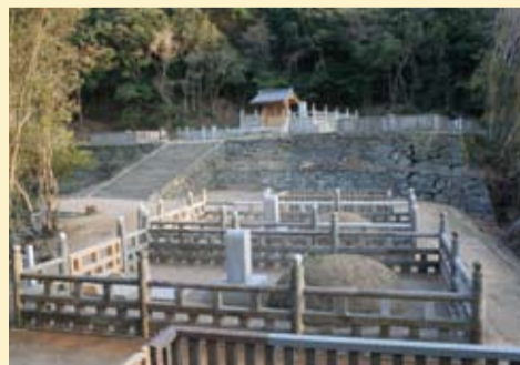
▲10代藩主と一族の墓

[申し込み方法] 万年山愛護連絡会(佐古公民館内 ☎656-1635)、社会教育課(☎621-5419)へ。