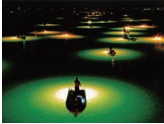
写真の部最優秀賞

「とくしま市民遺産」の魅力伝える作品を募集した「歩こう! 描こう! 写そう! とくしま市民遺産」絵手紙・写真コンクールの審査がこのほど行われ、入賞作品が決定しました。