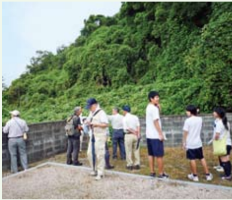
▲避難経路などを確認する津田中学校の生徒と自主防災組織の皆さん(津田山)

徳島市では、住民が主体となって、地域独自の防災マップを作成することを支援しています。このたび、モデル地区の一つである津田・新浜地区で、コミュニティ協議会や自主防災組織などが協力して、津波避難支援マップを作成しました。