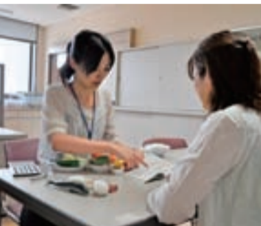
▲保健師が健康相談を行います

市国民健康保険加入者で特定保健指導の対象となる人には、保健センターが保健指導を行い、生活習慣改善のための健康・運動教室を実施しています。このような保健指導を受けることで、体重や腹囲の減少、血液検査値の改善などにつながっています。