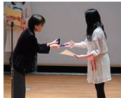
▲昨年度の授賞式=ふれあい健康館

【とき】 9月23日(祝)～10月10日(祝) 【会場】 △メイン会場 眉山山頂、林間駐車場、パゴダ周辺 ▽サテライト会場(イベント) Ⅱポッポ街、ボードウォーク、新町橋東詰公園など ▽サテライト会場(映画上映) Ⅱ阿波おどり会館(10月8日～10日)、徳島ホール(9月24日・25日・10月1日・2日)、オデオン座(9月23日・24日、10月1日・2日)、シネマサンシャイン北島(9月23日～25日、10月1日・2日)