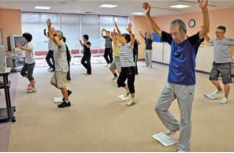
▲体を動かして、生活習慣病を予防しましょう (保健センターが特定保健指導の一環として実施している運動教室の様子)