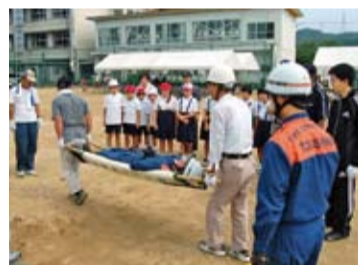
▲入田地区で行われた防災訓練の様子(7月)

■家具転倒防止対策推進事業の実施 自力で家具の固定が困難な高齢者などの世帯を対象に、家具の転倒防止器具の取り付けを支援してま