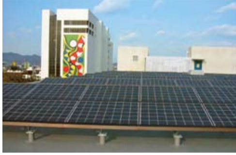
▲昨年度選定された取り組み=今切倉庫屋上に太陽光パネルを設置(大塚倉庫)

「対象」徳島市内に本店または事業所を置く企業や団体 「対象となる取り組み」夏の節電・省エネルギーの推進▽省資源・リサイクルの推進▽自動車