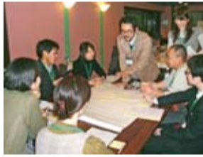
参加者を募集! 「ふらりエコカフェ」 ~食から見える徳島の環境~

「問い合わせ先」環境保全課 ☎(621)5213 ※選定された取り組みを紹介するパネルを作成し、イベントなどで展示します。展示後は、パネルを各社に贈呈しますので、自社PRなどに活用ください。