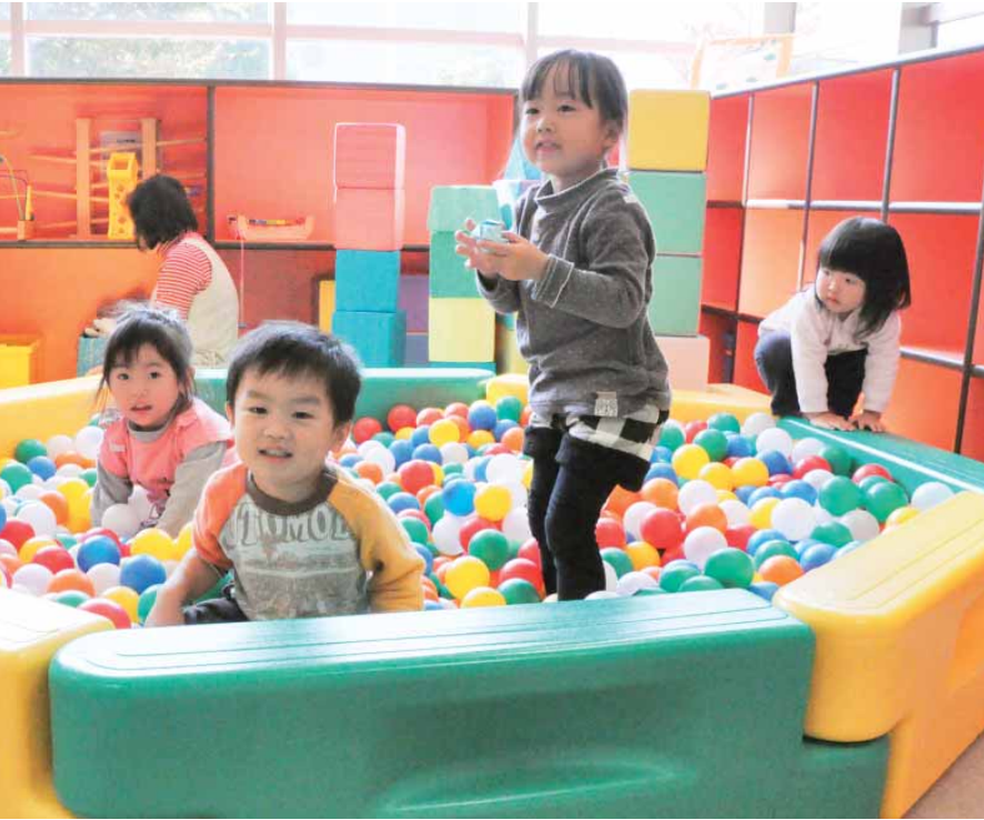
▲未来を担う子どもたちを地域全体で育てましょう

人口 258,128人(-2) 男 122,616人(+44) 女 135,512人(-46) 世帯数 112,288世帯(+46) 面積 191.62km 2