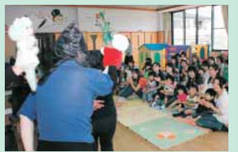
▲地域は子どもと保護者の交流の場

市では、子育てグループなどの依頼を受けて、「子育て応援・支援団」を派遣しています。団員は、保育士などの資格を持つ人や子育て経験のある市民ボランティアで、それぞれの資格や経験を生かし、子育てグループなどの活動をより充実したものにするお手伝いをしています。