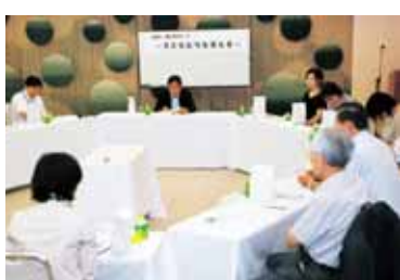
▲昨年開催した「熱々トーク」の様子

【申し込み方法】電話、はがき、メールでグループ名、活動内容と略歴、代表者名、連絡先を8月31日（火）までに、広報広聴課（〒770-8571 幸町2-5 ☎621-5091）へ。