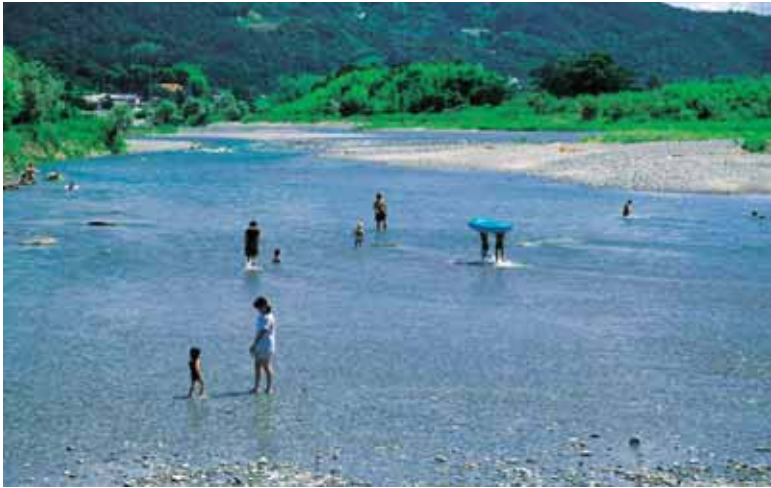
▲次世代にきれいな川や海を残しましょう

生活排水は、し尿排水(トイレの排水)と生活雑排水(台所、風呂、洗濯などの排水)に分かれます。し尿排水は浄化槽やし尿処理施設などですべて処理されています。一方、生活雑排水の65%は公