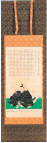
▶「10代藩主蜂須賀重喜画像」個人蔵

徳島藩主は、徳川家康から阿波国を与えられた初代藩主至鎮以降、14代を数えますが、それぞれの藩主についてはあまり知られていません。この展覧会では、新しく発見された徳島藩主の歴代肖像画を中心に、関