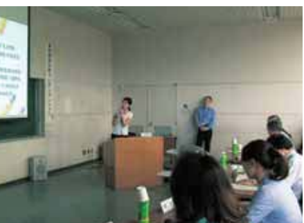
▲選考の一環で行われた公開プレゼンテーションの様子

決定した事業は、関係課との協議がととのいた次第、順次実施していきます。どの事業も市民の皆さんに関心を持って参加していただける内容となっていますので、ご期待ください。