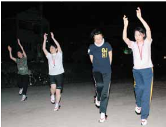
▲有名連の練習に参加し、直接指導を受ける参加者

徳島市とその周辺市町村でつくる「徳島東部地域体験観光市町村連絡協議会」が7月16日～19日、東京や名古屋、大阪などから15人の参加者を迎え、