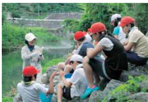
▲出前環境教室での水質検査の様子