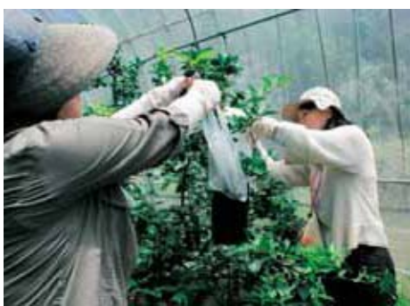
▲ハウスの中でスタダの収穫体験