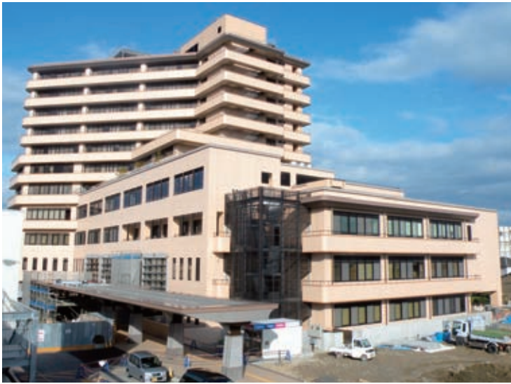
▶第2期工事の建物部分の工事を完了した徳島市民病院の外観