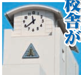
▲新校舎のシンボル「時計台」