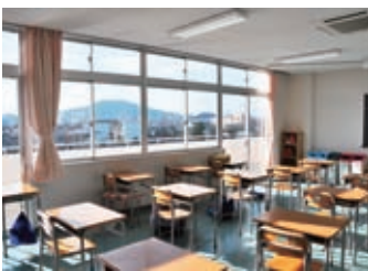
▲すべての教室から眉山が望めます