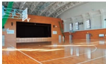
▲体育館メインアリーナ

「学問」では、良好な学習環境を確保するため、80席の自習室や少人数教育に対応できる複数の講義室を設置するとともに、南館(教室棟)は、流線型でど