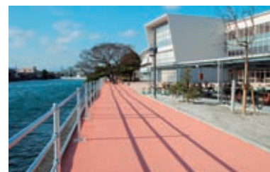
▲LEDの街路灯を設置した「さわやかロード」