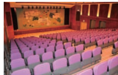
▲400人を収容できる芸術館「あしかびホール」