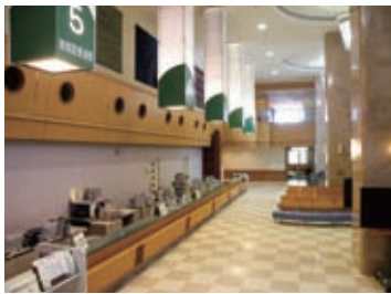
▶外来待合室 ▶エントランス・受け付け