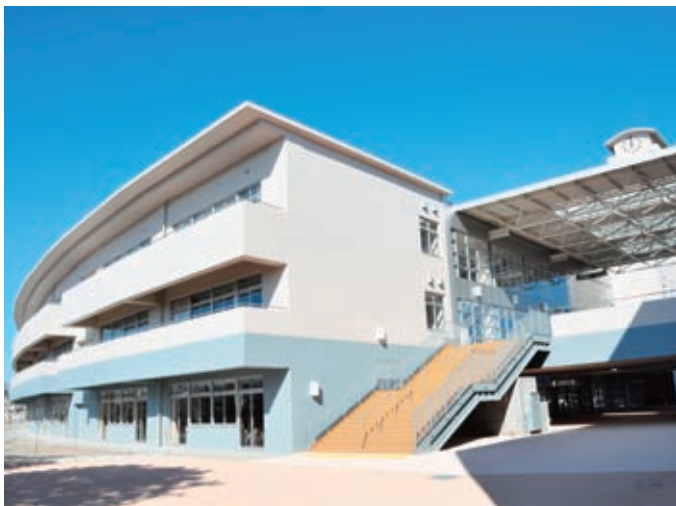
▲南館(教室棟)と、開放感あふれる生徒の憩いの場「リバービューデッキ」

徳島市では、特色ある魅力的な徳島市立高等学校の実現を目指して、公共建築物としては県内で初めてのPFI方式(民間企業の資金や経営ノウハウなどを活用すること)を採用した校舎などの整備事業を実施し、新校舎の建設を進めてきました。旧校舎の南側に完成した新校舎は、延べ床面積2万2766