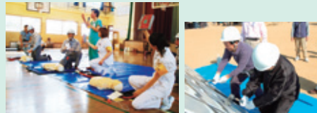
▲昨年11月に行われた市民総合防災訓練(津田地区)の様子