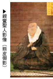
▲親鸞聖人影像(熊皮御影)

さんの偉業を称え、表彰状と記念品を贈呈しました。 銀メダルをはさんで原市長と歓談していた藤本さんは、大規模な中国での大会の様子を振り返りながら、「気持ち、体、環境が整えば4年後も挑戦したい」と話していました。