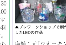
▲プレワークショップで制作したLEDの作品

「LEDが魅せる」とくしまの場所探しをしよう」をテーマに、次のとおりワークショップを開催します。 【とき】11月8日(土)13:30~16:30(雨天決行) 【集合場所】東新町1丁目商店街空き店舗:元「ウォーキンスストア」