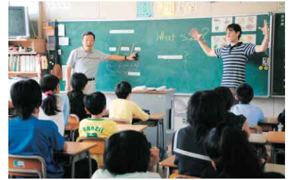
▲総合的な学習の時間に、担任と外国語指導助手が行っている小学校での外国語活動の様子

平成23年度から小学校高学年で外国語活動が必修化となるのにも関わらず、徳島市では、来年度から全小学校の5・6年生で外国語活動を先行実施します。年間35時間行 徳島市ではこのたび、学級担任の補助としてボランティアで活動していただける「小学校外国語活動サポーター」を次のとおり募集します。 【募集人数】30人程度 【応募資格】中学校または高等学校の英語教員免許状を持っている人、または教員免許状がな