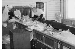
▲プラスチック製容器包装を選別作業している様子

しかし、資源ごみのうちプラスチック製容器包装とペットボトルについては、分別が不十分なためリサイクルに支障が生じているのが現状です。 プラスチック製容器包装では、汚れが付着していたり、ハンガー・歯ブラシ・