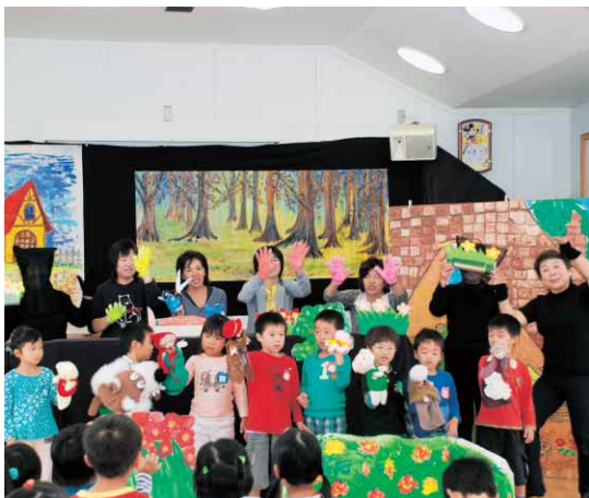
未来を築く子どもたちを 地域全体で育てましょう

(前月比) 人口 259,488人(-54) 男 123,387人(-4) 女 136,101人(-50) 世帯数 110,657世帯(+23) 面積 191.39km 2