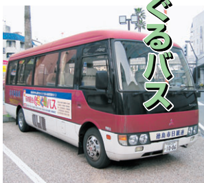
徳島市と徳島市日本観光旅館連盟などでは、眉山や新町川周辺の観光資源を生かしたイベント「眉山・新町川まるごと体験」を開催しており、その一環として、市内中心部をまわる循環型無料観光バスを運行しています。

【申し込み方法】往復はがき(1枚につき2人まで)に住所、名前(ふりがな)、電話番号、返信あて名を記入の上、10月1日(月)～9日(火)(当日消印有効)に、徳島市教育委員会社会教育課(〒770-8571 幸町2-5)へ。徳島市ホームページの「電子申請」からも申し込みできます。応募多数は抽選。 【問い合わせ先】社会教育課 ☎(621) 5419