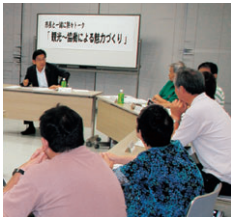
▲7月に開催された「熱々トーク」の様子

【申し込み方法】電話、はがき、または電子メールでグループ名・活動内容と略歴・代表者名・連絡先を9月25日(火)までに、広報広聴課(〒770-8571 幸町2-15)へ。