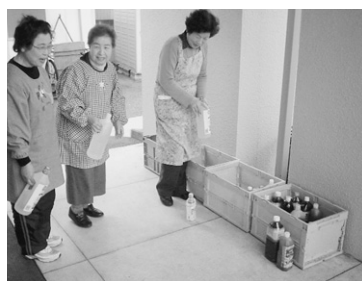
廃食用油を回収する資源ごみ回収団体の皆さん(東富田地区、富田生活学校)

す。また、実際に廃食用油を捨てる際には、古新聞や古布に吸わせて捨てることから、この数字以上にごみの減量を図ることができま