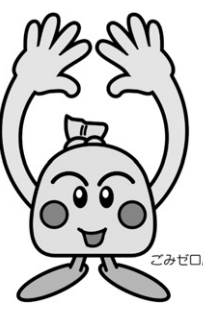
▲ごみ減量マスコット

一般から1年間に排出される廃食用油の平均量は、約10kgと言われています。もし、市内の11万世帯のすべての家庭で、発生した廃食用油をリサイクルすることができれば、1年間で1100トンの燃やせるごみを減らすことができ、1360万円のごみ処理費用