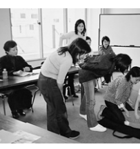
提供会員講習会の様子

【参加費】無料 【問い合わせ先】徳島ファミリー・サポート・センター (☎611-1551) 1. 商工労働課 (☎621-52225)