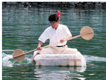
▲ペットボトルレースでボートをこぐ原市長＝新町川

私は子どもころは、父に連れられて吉野川で釣りをしたり、新町川で友達と貸しボートに乗りたりと、水にまつわる思い出はたくさんあります。当時の新町川は、水しぶきがかかると白い服が真っ黒になるくらい汚れていたほどですが、今では泳げるところまできれいになっています。