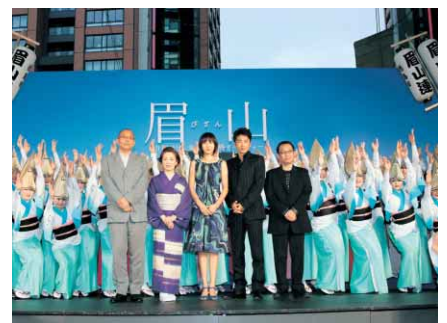
▲映画「眉山」完成報告会見で盛大にPRを行う「眉山連」＝東京・六本木ヒルズ