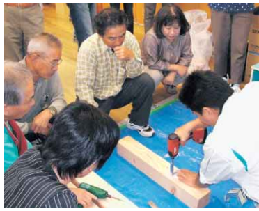
▲昨年度の協働支援事業・家具転倒防止ボランティア育成・派遣事業の実技講習会の様子

【募集要項】市民協働課窓口（市役所南館2階）で配布。徳島市ホームページからもダウンロード可。※より良い協働を行うため、応募の際は協働関係と話し合うことをお勧めします。