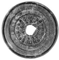
三角縁張は作六神四獣鏡(宮古古墳)

[展示資料] 鮎喰川下流域の古墳時代の集落跡、古墳など出土の銅鏡、武器、装身具、馬具、土器(土師器・須恵器)、埴輪など約500点。