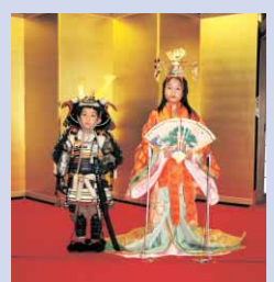
▲「お殿さま、お姫さまに大変身」の参加者＝昨年

◆百人一首競技かるた徳島県王座決定戦（個人戦） 【とき】5月3日（祝）10:00～（当日9:30～先着順で受け付け） 【定員】32人（小学生以上） ◆～雅の遊び～投扇興王座決定戦 【とき】5月4日（祝）13:00～（当日12:15～先着順で受け付け） 【定員】80人（小学生以上） ◆お殿さま、お姫さまに大変身 【とき】5月5日（祝）13:00～（当日12:15～先着順で受け付け） 【定員】男女各40人（身長110センチ以上） ※いずれも参加無料。ただし、高校生以上は入館料（一般300円、高校・大学生200円）が必要です。 【問い合わせ先】徳島城博物館 ☎656-2525