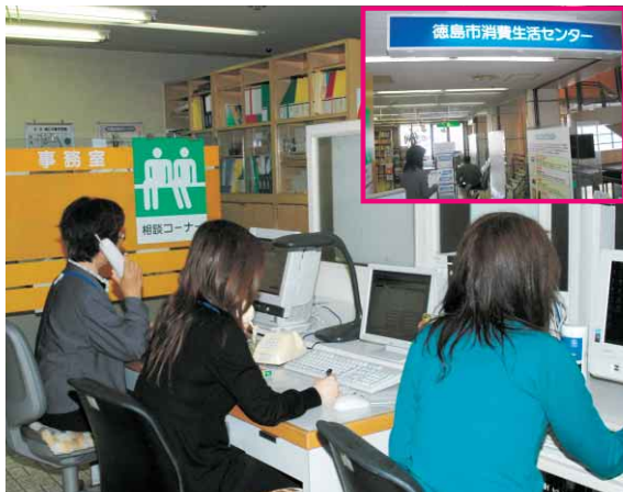
消費生活センターでは、さまざまな消費生活の相談を電話や来所でも受け付けています。

徳島市消費生活センターに寄せられている悪質商法に対する相談は、年々増加の傾向にあり、年間で約2