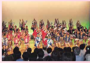
▲子どもたちメーンの有名連の公演風景

開館7周年を記念して開催します。 1階では ◆徳島の伝統工芸品「藍染」製品の展示即売 ◆お楽しみ抽選会=1階ショップ「あるでよ徳島」で2,000円以上お買い上げの人対象に抽選で品物を贈呈 【とき】 7月28日(金)～30日(日) 2階では ◆子どもたちメーンの有名連特別公演 【とき】 7月30日(日)10:00～11:00(各40分) ◆専属連「阿波の風」特別公演 【とき】 7月30日(日)14:00～15:00/16:00～(各40分) 3階では ◆阿波おどりミュージアム終日入場無料 【とき】 7月30日(日) 【問い合わせ先】 阿波おどり会館(☎611-1611)