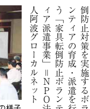
▲公開プレゼンテーションの様子

▼学習療法技術を導入した脳の健康教室を実施する 「脳いきいき介護予防事業」 ▼NPPO法人なのはな徳島▼障害者が安心して歩けるように高校生と直接対話する「徳島市交通バリアフリー」基本構想啓発活動事業 ▼徳島市身体障害者連合会▼川からみた都市景観についてデザイン調査などを行う「ひょうたん鳥・景観まちづくり事業」