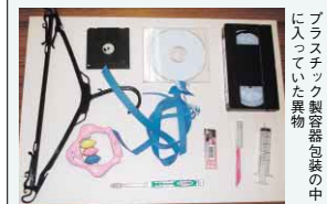
特に、ライター・カミソリ・注射器などの危険物は混入しないようご注意ください。

中身の残ったみそのカップ容器やコンビニ弁当の容器など、汚れたままの容器包装は、リサイクルに支障があるばかりか洗って出された他の容器包装までも汚れてしまいます。必ず、中身を使い切り、洗ってから出してください。 また、材質がプラスチックであっても、次のものは容器包装の対象ではなく、「燃やせないごみ」となります。 ●商品そのもの=ライター、カセットテープ、歯ブラシ、おもちゃ、ハンガーなど ●携帯・保管用ケース=フロッピーディスク、CDのケースなど ●洗浄が困難であるもの、または洗っても汚れが落とせないもの=練りわさび、歯磨き粉のチューブなど、内容物による汚れが落とせない製品 ●結束用のバンド・ひも(※容器にも包装にも該当しないため)