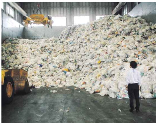
プラスチック製容器包装中間処理施設では 収集した物を選別・圧縮しリサイクル工場へ搬送します

「マイシティとくしま」(四国放送テレビ) 毎週日曜日 11:50~正午放送 「徳島市NOW」(ケーブルテレビ徳島) 毎日3回週替わりで放送