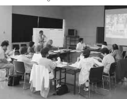
昨年の講座の様子

徳島市では、市民の皆さんに、さまざまな環境保全活動を広めていく「環境リーダー」の養成講座を開講します。