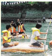
▲ペットボトルレース

新町川周辺で、楽しい一日を過ごしてみませんか。 【とき】 7月23日(日)10:00～21:00 【ところ】 しんまちボードウォーク周辺 【内容】 ◆徳島ひょうたん島川祭り ◎ペットボトルレース(10:00～16:00) 手づくりのペットボトル船に乗って、新町川でレースが行われます。 ◎Tシャツアート展(10:00～16:00) ◆夏休みの宿題をパラソルショップで作っちゃおう!(10:00～17:00) ◆LEDアートコンテスト(18:30～21:00) ◆日本の盆踊り(17:00～18:30) ちびっ子阿波おどり・よさこい・エイサー ◆産直市(17:00～) ◆スーパー・アカベラライブ(19:00～)など 【問い合わせ先】 徳島商工会議所(☎653-3211)、または商工労政課(☎621-5225)