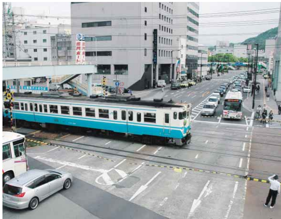
列車通過時の花畑踏切

「マイシティとくしま」(四国放送テレビ) 毎週日曜日 11:50~正午放送 「徳島市NOW」(ケーブルテレビ徳島) 毎日3回週替わりで放送