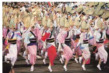
クライマックスを演出する阿波おどり

となれば、二千人を超えるエキストラが必要となる見込みです。ほかに、ロケ撮影を円滑にするためのさまざまなサポートや、この映画制作を盛り上げるための支援は、多方面にわたることが想定されます。