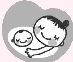
マタニティマーク