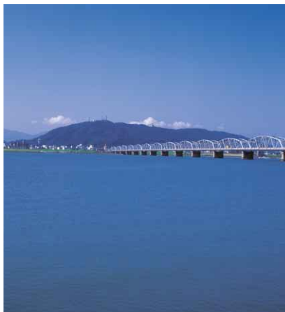
吉野川から望む眉山

シンガー・ソングライター・さだまさしさんの小説「眉山」の映画化が、東宝映画（本社・東京都）で企画されており、本年に制作される予定です。小説の内容から、阿波おどりや徳島市内各地での大規模なロケ撮影が予想されます。徳島市では、このほど東宝映画