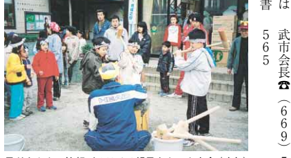
子どもたちの笑顔がはじける親子もちつき大会(昨年)

年以降。自動車関連企業が進出した30年代から宅地開発も活発になり、東部地域から都市化が進みました。平成元年には、勝占町に徳島ガラススタジオが誕生。ガラス工芸という新文化拠点を生かして住め