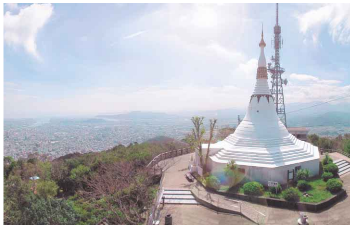
眉山は、眺望の素晴らしいとともに、身近な自然に親しめる場所です。

●徳島市の広報番組 「マイシティとくしま」(四国放送テレビ) 毎週日曜日 11:50~正午放送 「こんにちは徳島市です」(ケーブルテレビ徳島) 毎日4回交替わりて放送