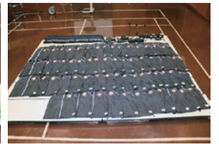
▲少年消防クラブ活動資器材(帽子・ウインドブレーカー・撮影機器一式)