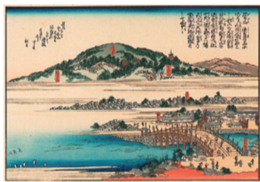
▲文化8(1811)年刊行の旅行案内書「阿波名所図会」

新町橋は、江戸時代に町人が暮らした内町と新町間の新町川に架けられた橋です。架橋の具体的な時期は判明していませんが、1630年頃の絵図に描かれていることから、藩祖蜂須賀家政が徳島城築城に着手した天正13(1585)年から間もない頃と考えられます。