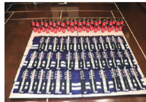
▲婦人防火クラブ活動資器材(法被・訓練用水消火器)

徳島市ではこの事業により、令和4年度に、①婦人防火クラブ、幼年消防クラブおよび少年消防クラブへの活動資器材②阿波おどり備品③防災資器材(下写真)——を整備しました。