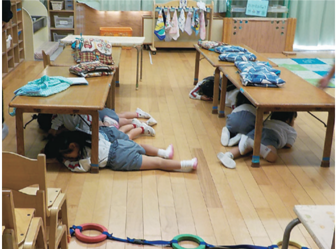
▲シェイクアウト訓練の様子

■シェイクアウト訓練とは シェイクアウト訓練は、2008年にアメリカで考案された新しいかたちの訓練方法です。指定された日時に、一斉に参加者全員が「まず低く」「頭を守り」「動かない」という3つの動きで身の安全を図る行動を実践していただき、日頃の防災対策を確認するきっかけづくりとする訓練です。