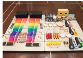
▲幼年消防クラブ活動資器材(楽器一式)