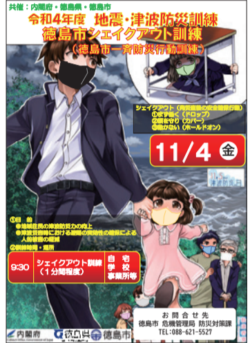
▲シェイクアウト訓練参加啓発ポスター