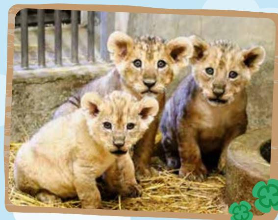
▲生後2カ月ごろの「ムーン」(一番左)、兄2頭と一緒に

父親はリク、母親はアマレット、兄が2頭。「ムーン」という名前は、父親のリクと叔父のソラから連想した、地球や天体にちなんだものです。