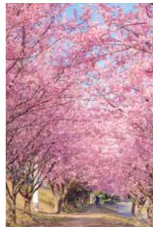
▲昨年度の準特選作品「春色のトンネル」