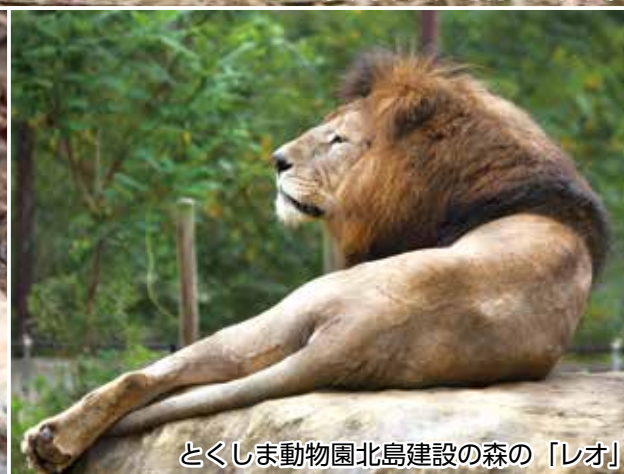
とくしま動物園北島建設の森の「レオ」

とくしま動物園北島建設の森に待望の雌ライオンが仲間入りすることになりました。これまでライオンは雄の「レオ」だけでしたが、今後は2頭が仲良く生活する姿や、赤ちゃんの誕生が期待されます。