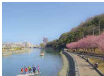
▲昨年度の準特選作品「水都の花見」

【投票期間・場所】4月26日(日)～5月6日(木)（4月27日(月)は休園）各日9:30～16:00に、同園緑の相談所で実施