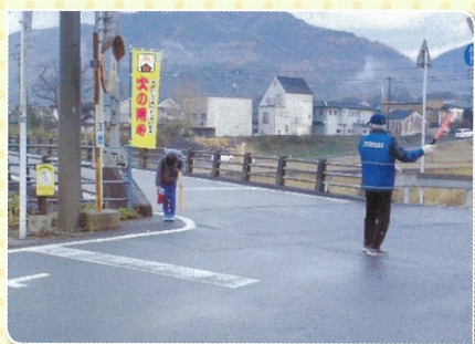
登校時の安全指導

学校支援ボランティアの皆様のご協力により、授業や部活動の補助、登下校の見守りなど、学校教育活動に支援いただいています。