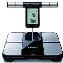
手足の 筋肉量測定