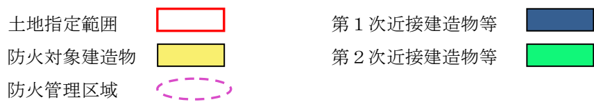
图1 防火管理区域图