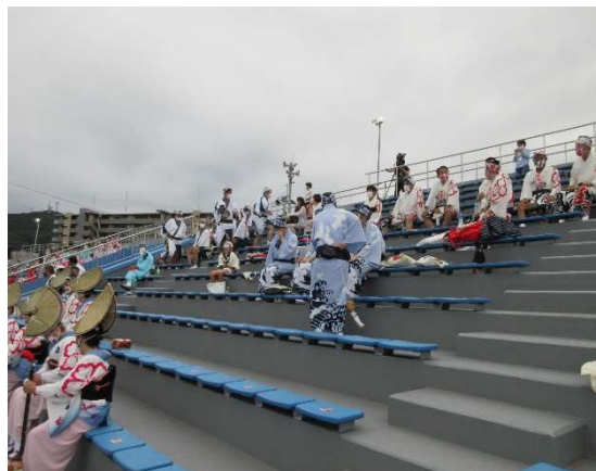
・グランドフィナーレ待機場所