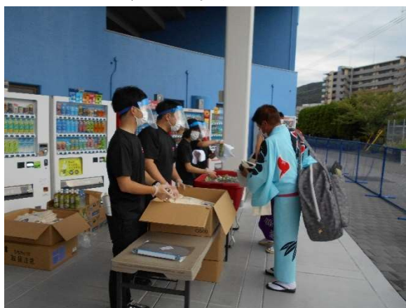
・グランドフィナーレ受付