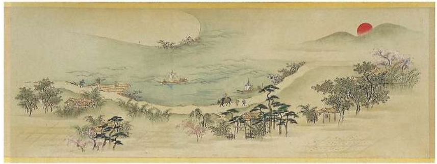
徳島市指定文化財 養性軒十六詩画卷 七條寿庵作・赤井得水書・佐々木信照画