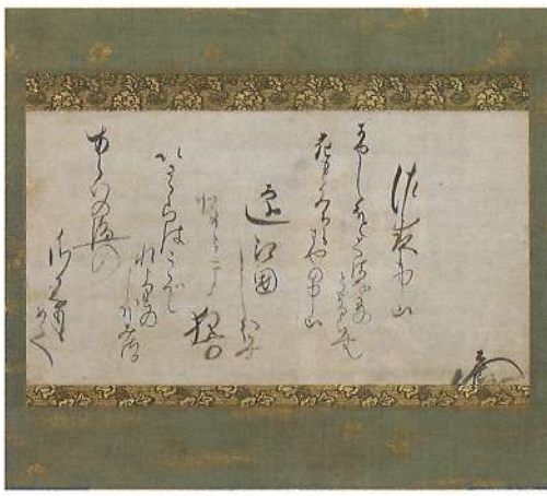
和歌詠草 烏丸光広筆