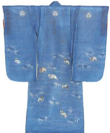
浅葱紹地子犬世模様産着