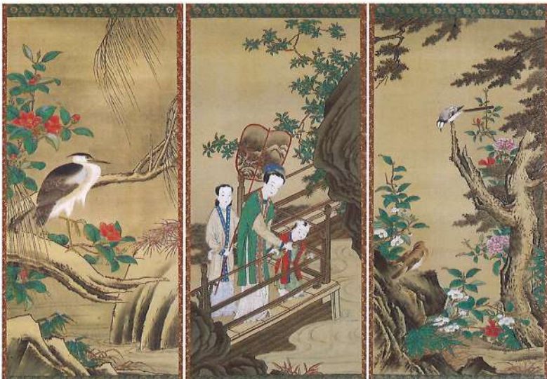
虞美人・花鳥図 蜂須賀載筆